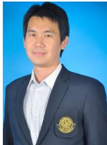
รศ.ดร.ศักรธร บุญทวีวัฒน์ ด้านบริการวิชาการ